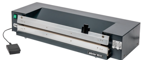
601 M mit Schneidvorrichtung