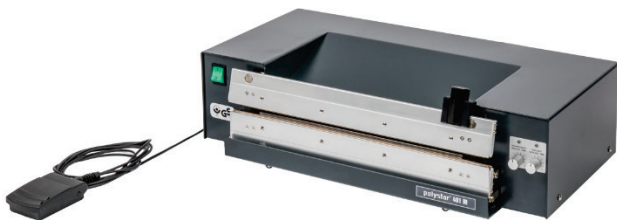
401 M mit Schneidvorrichtung