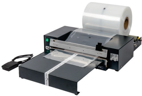
401 M mit Schneidvorrichtung Anstecktisch und Abroller

Magnet-Tischschweißgeräte mit vertikalen Schweißschienen