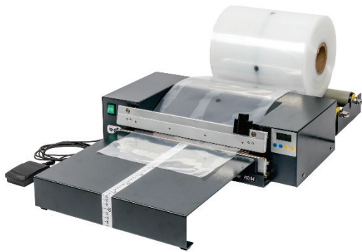
413 M mit Schneidvorrichtung Anstecktisch und Abroller

Magnet-Tischschweißgeräte mit vertikalen Schweißschienen