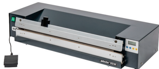
613 M mit Schneidvorrichtung