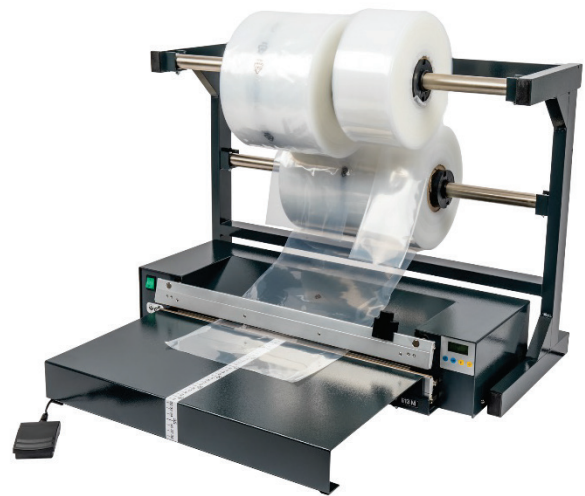
613 M mit Schneidvorrichtung Anstecktisch und Magazin